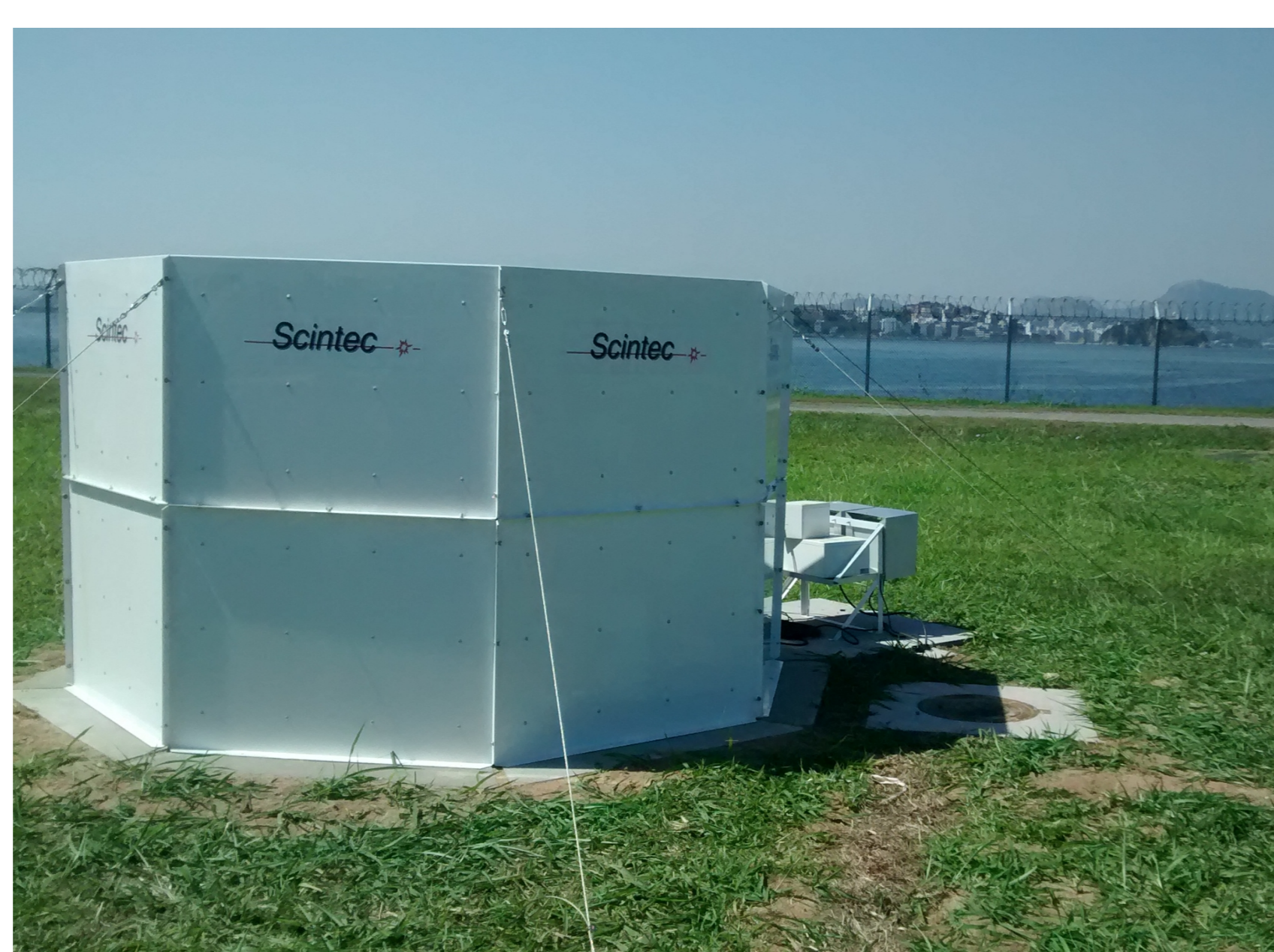
Figura 2 – SODAR do Aeroporto Santos Dumont.