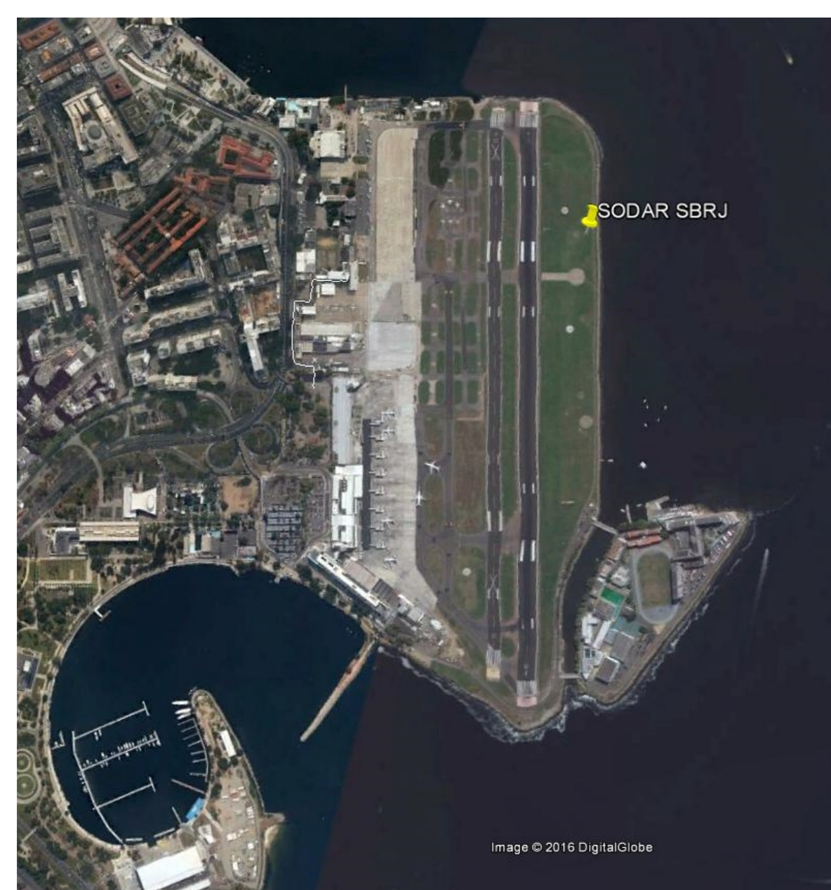
Figura 1 – Localização do SODAR no Aeroporto Santos Dumont.

Os períodos considerados foram os das Olimpíadas e Paraolimpíadas. Os dados brutos foram processados e disponibilizados pelo Laboratório de Meteorologia Aplicada (LMA) da Universidade Federal do Rio de Janeiro (UFRJ), ao qual faz estudos e experimentos com o CTECA. A partir daí foram elaborados mapas para acompanhamento das componentes (velocidade e direção), o que possibilitou a comparação com o METAR do Santos Dumont. O uso do SODAR possibilitou a observação da direção e intensidade do vento nos níveis mais baixos da troposfera, com frequência temporal de 15 minutos