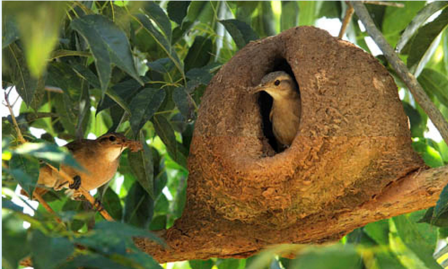
João de Barro