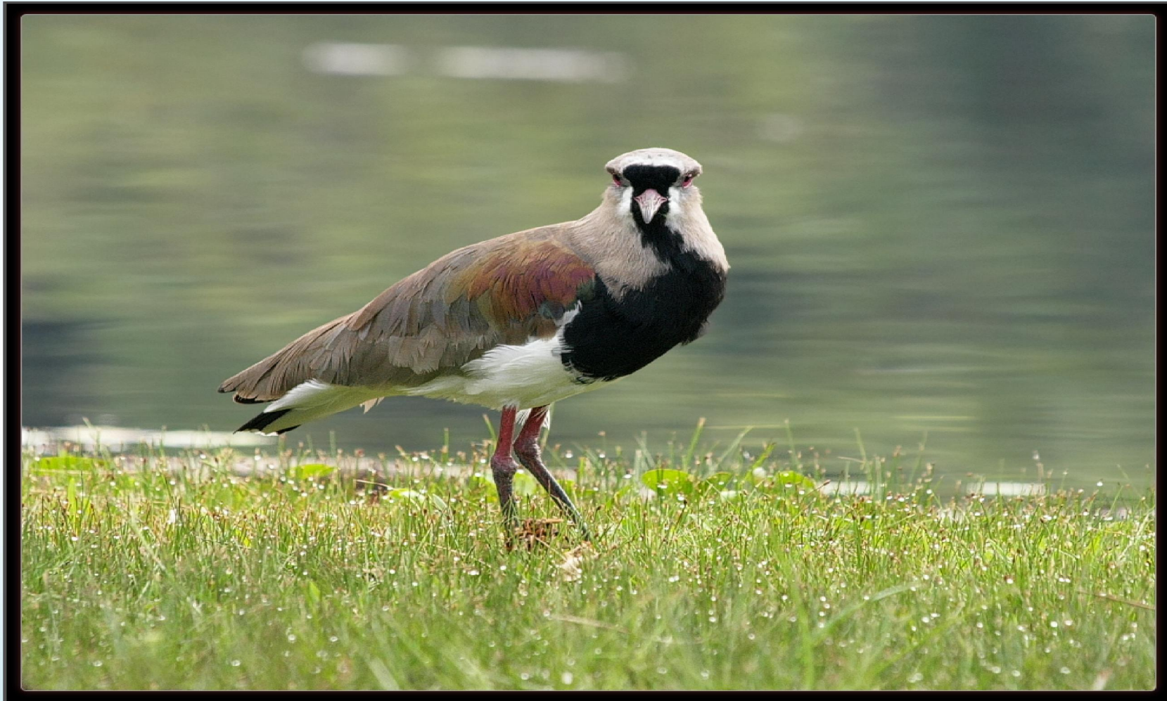
Quero - Quero