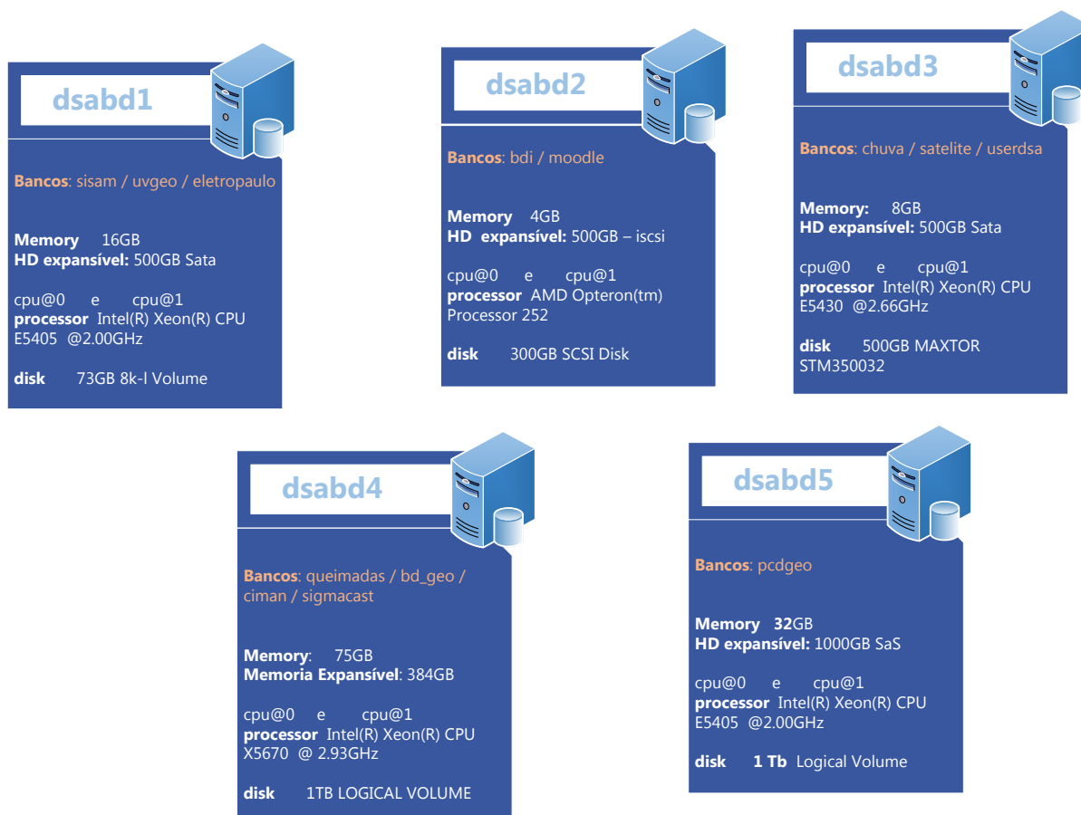
Figura 1- Servidores de Banco de Dados da Divisão

A Divisão de Satélites e Sistemas Ambientais ( DSA ), com intuito de realizar pesquisas criou uma Base de Dados Ambiental, que incluem dados de focos de queimadas, precipitação, plataformas de coleta de dados, descargas elétricas, radiação solar entre outros, formando assim uma grande fonte pesquisa com dados históricos de cada área de aplicação. Para manter a segurança desse acervo, realizamos constantemente o backup contínuo desses dados.