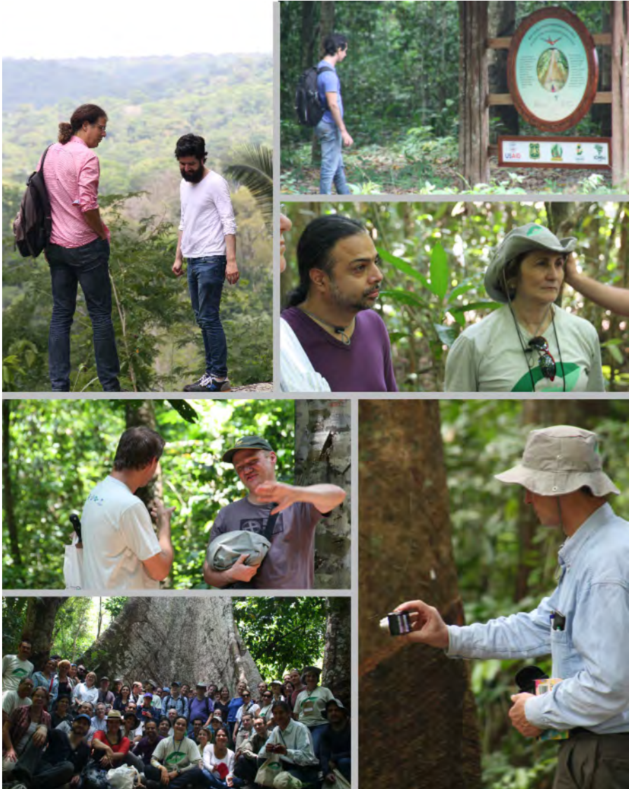
Figura 3. Registros fotográficos durante a visita técnica na Trilha Ecológica “Terra Rica”, na Flona Tapajós.