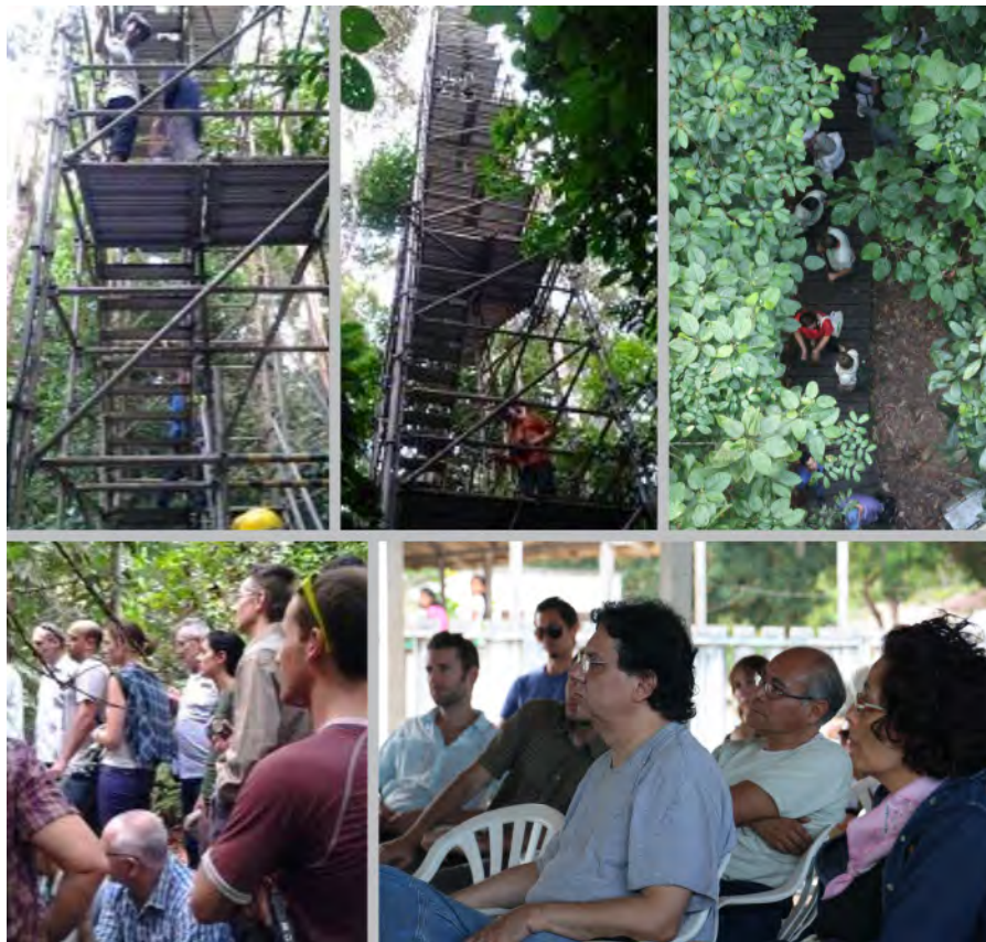
Figura 4. Visita à Torre do Projeto LBA.

na Amazônia (LBA) e as pesquisas realizadas a partir dos dados obtidos. Posteriormente, os participantes subiram, usando capacete de proteção, sendo estabelecido que o acesso à torre deveria ocorrer em grupos de três pessoas para contemplar o dossel da floresta (Figura 4).