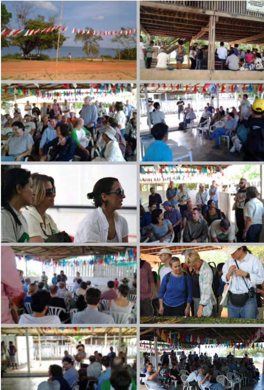
Figura 2. Imagens obtidas durante a visita técnica na Comunidade Maguarí, Flona Tapajós.