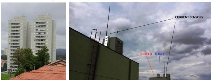
Figura 1 – Sensores instalados no topo dos prédios em Pirituba - SP.

Com a finalidade de entender melhor os processos de propagação dos líderes e de conexão com estruturas comuns nos centros urbanos, foram instalados sensores de corrente, campo elétrico atmosférico e raios-X no topo de dois prédios isolados, situados em uma região com perfil plano da cidade de São Paulo que apresenta densidade de descargas de 11 descargas/km 2 /ano. Todas as medidas são realizadas utilizando um sistema de aquisição de dados com alta resolução temporal e sincronizadas no tempo por GPS.