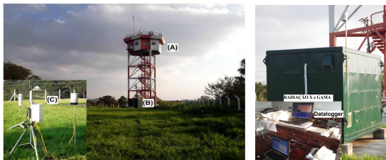
Figura 2 – Sensores instalados em São José dos Campos - SP

Para realizar o monitoramento dos dados ininterruptamente, exceto dados de campo elétrico, no período de 01/04/2013 a 31/05/2013, em intervalos fixos de 1 minuto, foram utilizados dispositivos alocados em um trailer (Figura 1B) próximo a Torre de Observação de Fenômenos Atmosféricos - TOFA (Figura 1A) do Instituto de Aeronáutica e Espaço - IAE, em São José dos Campos, SP, Brasil.