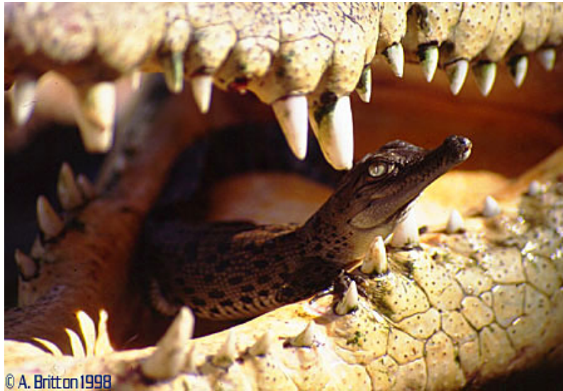
Figura 1.2 - Ilustração do comportamento materno de uma fêmea crocodiliana que carrega gentilmente seu filhote na boca – São José dos Campos – 2014